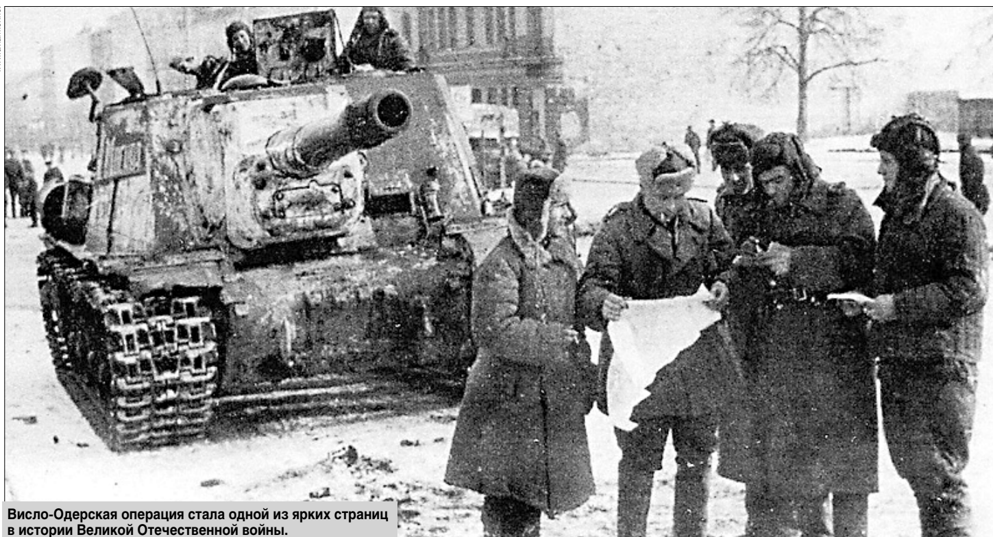
Висло-Одерская операция стала одной из ярких страниц в истории Великой Отечественной войны.

— сведения о размере регулируемой сбытовой надбавки в июле 2013.